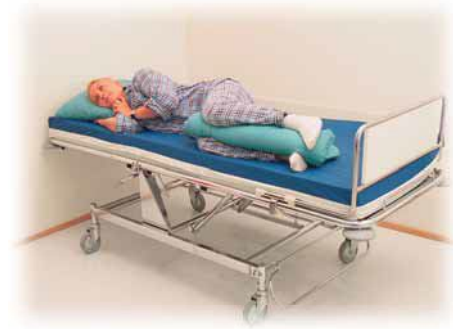
Polvien ja nilkkojen väliin.