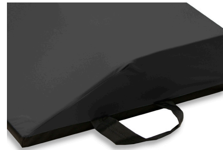
Exact™ Hip-korotustyynyssä on vakiona kantokahva.