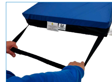
Kuva 4. Vetohihna.