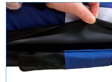
Kuva 5. Laskostettu vetohihna.