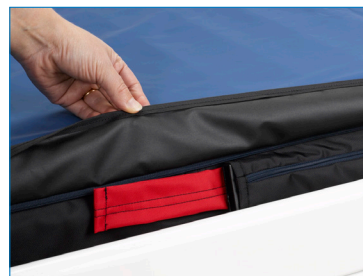
Kuva 3. Kiinnityshihnan punainen pää.