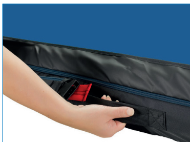
Kuva 1. Patjan käsittelyä helpottavat kahvat.

Vetohihnat on laskostettu päällisen tippaläpän alle (kuva 5). Vetohihnat kiinnittyvät leveysuuntaisesti patjan nurkkiin.