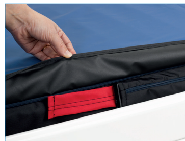
Kuva 3. Kiinnityshihnan punainen pää.