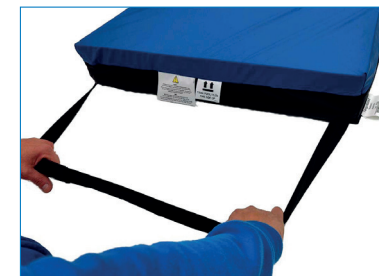
Kuva 4. Vetohihna.