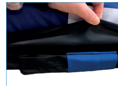
Kuva 5. Laskostettu vetohihna.